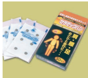
セラミックバン(医療機器認可品)