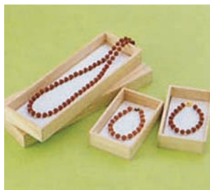
ネックレス/ブレスレット

数億年もの長い間、深海の堆積層に含まれていた微砂(ピサ)を取り出し特殊技術でセラミック化したものです。この物質は、人口的に生成できない18種類以上の微量元素から構成されており吸着・触媒・抗菌作用と遠赤外線放射は生物に有効作用するといわれている。8~14ミクロン放射域での放射率は98%と他に類を見ない特殊機能セラミックです。この新しいエネルギー「コスモビサ」は血流を促進し、万病の元となる冷えを防ぎ健康をもたらします。