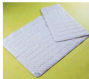
かいらくみん(安眠マット)