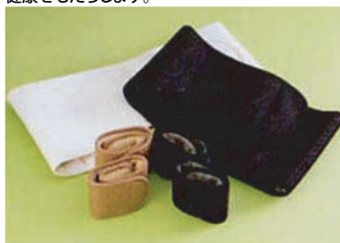
ウエストサポート/レッグ&リストサポート